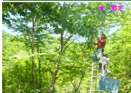
★ 剪定 ★ 消毒